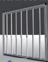
Modello sbarre verticali