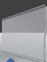
Vidrio laminado 6mm