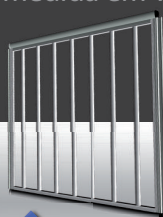
Versão a barras